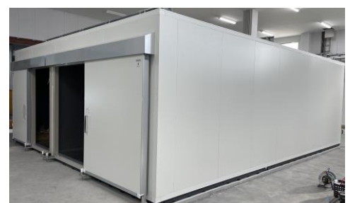
経済的なカラー鋼板外装も選択可能