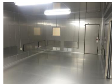
自社製パネルヒーター