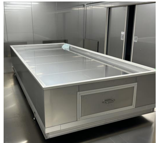
ステンレスパネル製床台