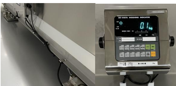
ロードセルは、100g 単位まで測定可能